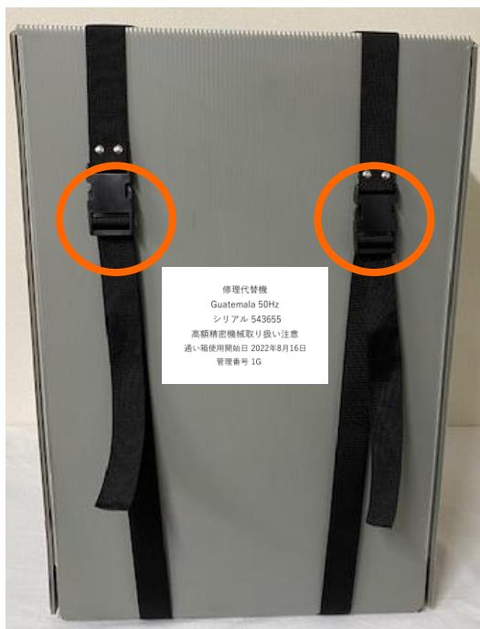
通い箱外観とバックル位置